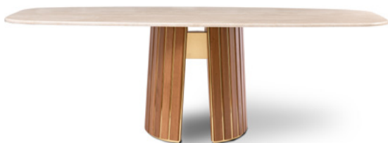
055201 — Dining table

Brass or Matte Black finish. Leg joint component with finish to match the inserts. Base — Wood covered in sheet metal with finish to match metal leg inserts. Table top — Bevelled top in wood with finish to match the structure, or in the marbles of the collection with matte finish.